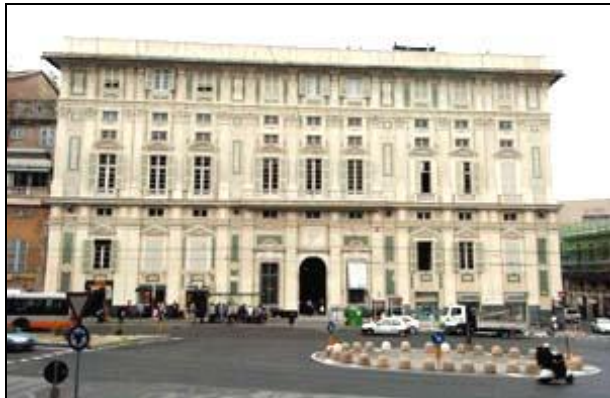
Figura 3 Piazza della Nunziata con Palazzo Belimbau