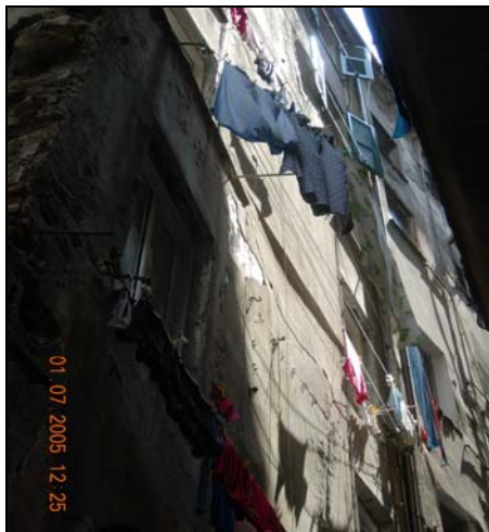
Figura 7 Vicolo Croce Bianca