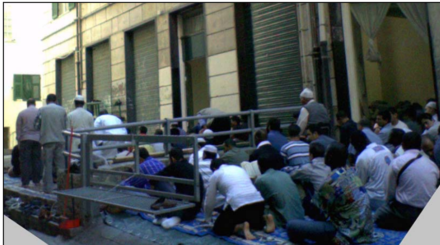
Figura 11 Musulmani raccolti in preghiera in Vico dei Fregoso

L'azione prevede otto focus group . L'attività potrebbe svolgersi all'interno del magazzino-Moschea che gli immigrati utilizzano per la preghiera; la familiarità dei luoghi è una condizione importante per far sentire gli interlocutori a proprio agio. Il gruppo discuterà su di un tema specifico (ad esempio: la convivenza in un quartiere multiculturale) che sarà approfondito nel corso dei successivi incontri; oppure saranno gli stessi partecipanti a proporre delle questioni che gli stanno particolarmente a cuore. L'intento è quello di dare inizio ad un primo dialogo con la popolazione immigrata. Le informazioni raccolte durante la discussione saranno trascritte di volta in volta su di una lavagna e riportate in un documento finale, un opuscolo, da distribuire ai residenti del Ghetto ed eventualmente anche alle realtà organizzate del Centro Storico. Accanto al classico facilitatore sarà richiesta la presenza di un mediatore culturale. Inoltre, ogni gruppo sarà composto di un numero massimo di quindici persone. Ricordiamo che il ruolo dei facilitatori è quello di coordinare gli interventi dei partecipanti, consentendo un'equa partecipazione dei presenti; rispettare i tempi del programma di lavoro; coordinare la discussione finalizzandola agli obiettivi del percorso.