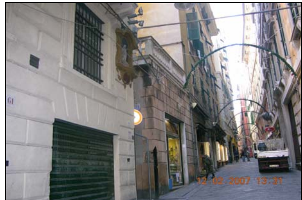
Figura 6. Via del Campo

La centrale Piazza della Nunziata, a monte del Ghetto (figura 3), è lo snodo di tutto il traffico genovese, sia con riferimento alla viabilità pedonale che al traffico gommato; ciò consente ai residenti del quartiere di poter essere adeguatamente serviti dai mezzi del trasporto pubblico. Va sottolineata, inoltre, la vicinanza alla stazione ferroviaria di Principe e alla fermata della metropolitana della Darsena.