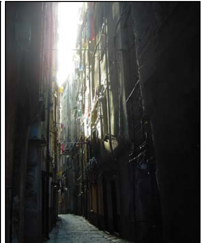
Figura 9 Vicolo Untoria

Le foto sottolineano solo alcuni aspetti del tessuto edilizio e ambientale del quartiere, che possono essere sintetizzare nei seguenti punti: