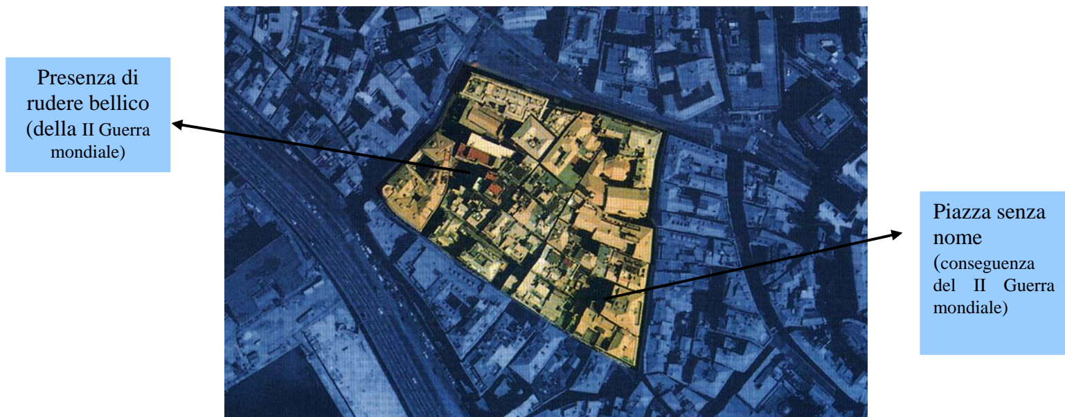
Figura 2 Ripresa del Ghetto dall'alto.

Il Ghetto si presenta come un tramato di vicoli a scacchiera e di isolati composti di edifici abitativi disposti a doppia schiera racchiusi da un quadrilatero di vie principali che costruiscono il suo perimetro e che sono: Via Lomellini, via del Campo, via delle Fontane, Piazza della Nunziata (come si osserva dalla figura 10). Nell'area, nonostante le successive trasformazioni che hanno dato luogo ad edifici che possiamo considerare di età moderna, rimangono ancora tracce dell'assetto medievale, soprattutto nella parte più interna. Nel quartiere gli spazi sono esigui, i pochi vuoti presenti sono dovuti alle demolizioni conseguenti ai bombardamenti della Seconda Guerra Mondiale, di cui rimangono ancora dei segni (vedi figura). È proprio in seguito al crollo di un edificio bombardato (compreso Vico di Untoria e vico dei Fregoso cfr figura10) che oggi il quartiere può usufruire di un importante spazio, la così detta piazza senza nome 3 , elemento di particolare importanza in un contesto dove gli spazi sono carenti. La piazza, però, è poco valorizzata e spesso utilizzata in modo improprio dai residenti, prevalentemente come discarica per i rifiuti.