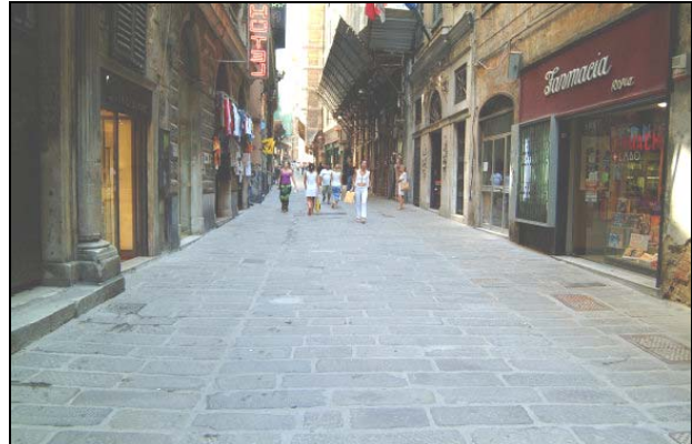
Figura 4 Via Lomellini, nella via sono ubicati il complesso di S. Filippo e La casa di Mazzini