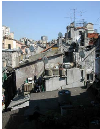
Figura 8 una delle tante sopraelevazione