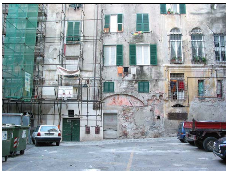
Figura 13 Piazza senza nome, come appare oggi