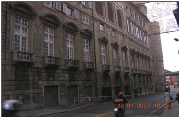
Figura 5. Via delle Fontane, Palazzo Serra