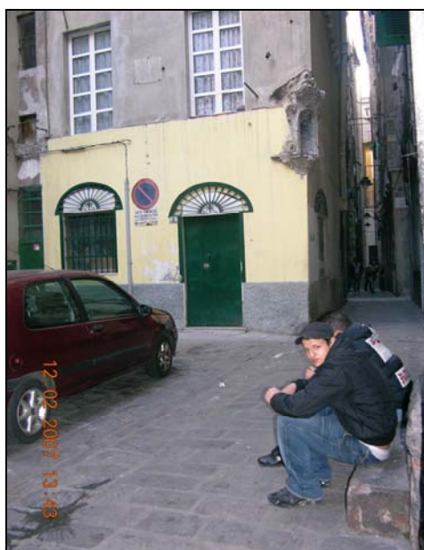
Figura 12 Giovani marocchini del Ghetto

L'azione prevede otto incontri di brainstorming . L'idea del gioco quale dimensione leggera che permette di liberare la creatività dei singoli e del gruppo, che vi è alla base di questa tecnica la rende particolarmente indicata per i gruppi di più giovani. Il tema è la promozione di soluzioni per l'utilizzo di alcuni spazi del quartiere attualmente inutilizzati o utilizzati impropriamente. La prima proposta avanzata dagli organizzatori riguarderà lo spazio di piazza senza nome, un importante realtà all'interno del Ghetto usata spesso come “discarica”. Al fine di stimolare le proposte dei ragazzi, in occasione del primo incontro si suggerirà ai partecipanti di adottare l'iniziativa: “ribattezzare” Piazza senza nome, ovvero di scegliere in maniera concordata e condivisa un nuovo nome per la piazza.